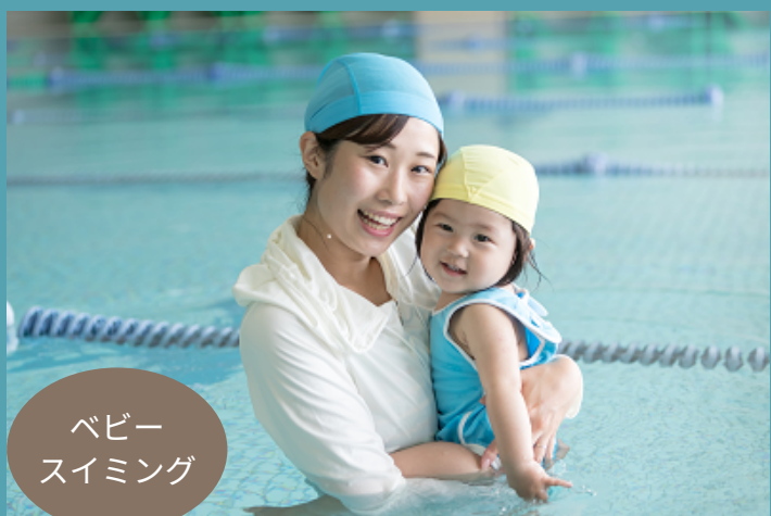
ベビー スイミング